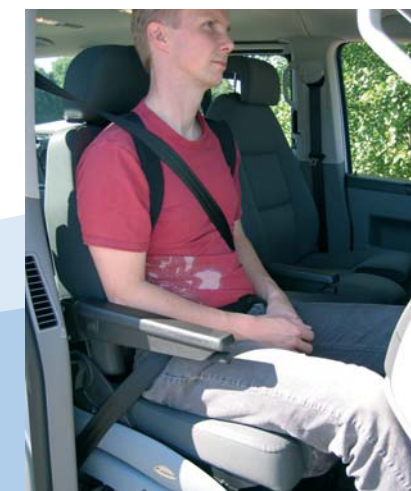
On utilise ici la ceinture d'épaule (produit disponible sur commande, avec un délai de livraison un peu plus long, voir la page suivante).