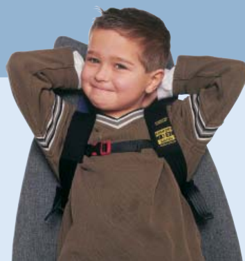
La Ceinture d'épaule avec Boucle de fermeture.