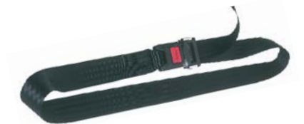
Une ceinture de base de 150 cm de long, permettant le verrouillage derrière le dossier du fauteuil.

La ceinture Careva est également un excellent moyen d'assurer la stabilisation dans un fauteuil roulant à dossier fixe