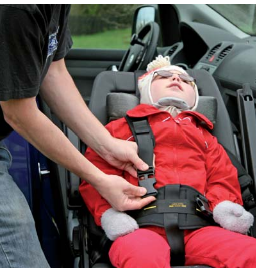
La fermeture et l'ouverture de la ceinture sont rapides et simples