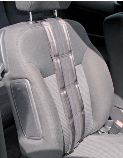
La Ceinture de Base, serrée autour du dossier, comporte 5 canaux dans lesquels les différentes ceintures sont fixées.