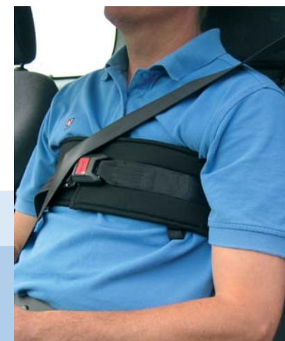
Ceinture de Poitrine Careva.

(Le marquage CE indique que le produit est conforme à la directive européenne sur les techniques médicales).